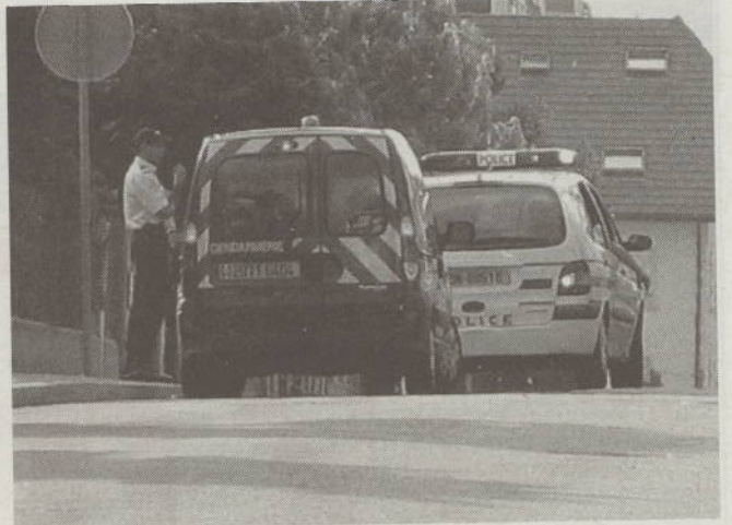
Il est 18 h 45 : la fourgonnette de gendarmerie emmène le prévenu. La première phase de la reconstitution s'achève.