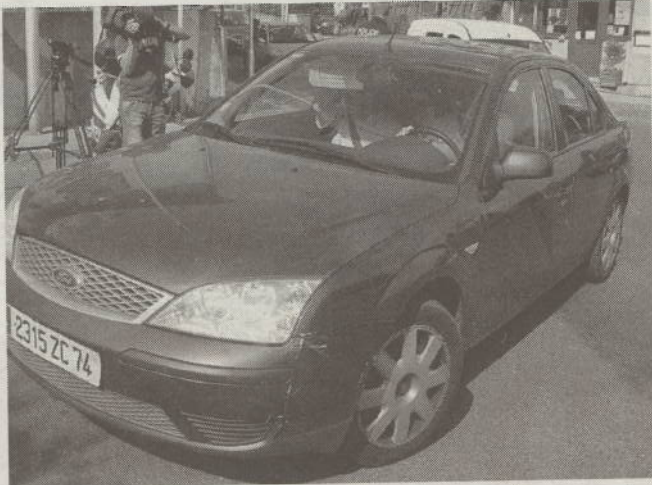
Le bal des officiels (magistrats, avocats, enquêteurs, etc.) a lancé la reconstitution officielle qui a débuté vers 17 h 15.