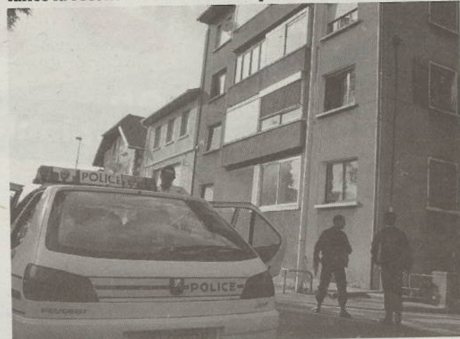
L'immeuble du crime situé au 33 de la rue du Châtelet était étroitement surveillé.